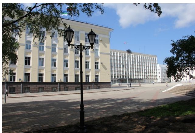
Стефановская площадь города Сыктывкара

1 июля 2020 года в Сыктывкаре прошло Общероссийское голосование по вопросу одобрения изменений в Конституцию РФ, в котором приняли участие 58,4% сыктывкарцев и эжвинцев (в том числе 57,8% жителей Сыктывкара и 60,5% – Эжвинского района). Из них поддержали изменения в Конституцию 58,2% жителей муниципального образования (в том числе 57,7% сыктывкарцев и 60,5% эжвинцев). В республике в Общероссийском голосовании