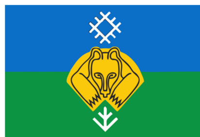
Флаг города Сыктывкара