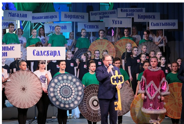
Фестиваль «Сияние Севера». 8 ноября 2018 года

В 1990-е годы были закрыты кинотеатры «Горизонт», «Луч», «Октябрь», «Родина», «Строитель». В 2002 году в здании администрации города открылся кинозал «Парма-2». В 2003