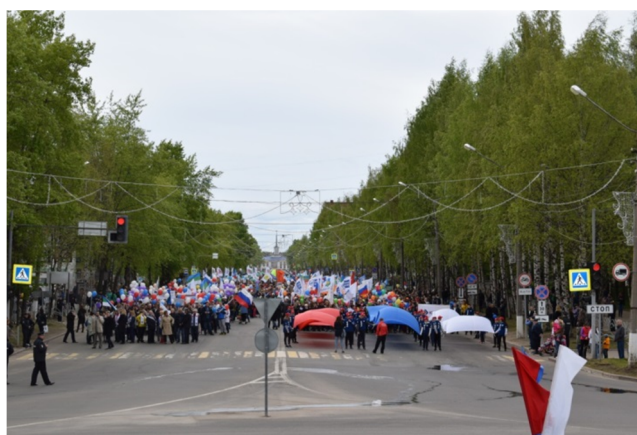
День города Сыктывкара 12 июня 2013 года