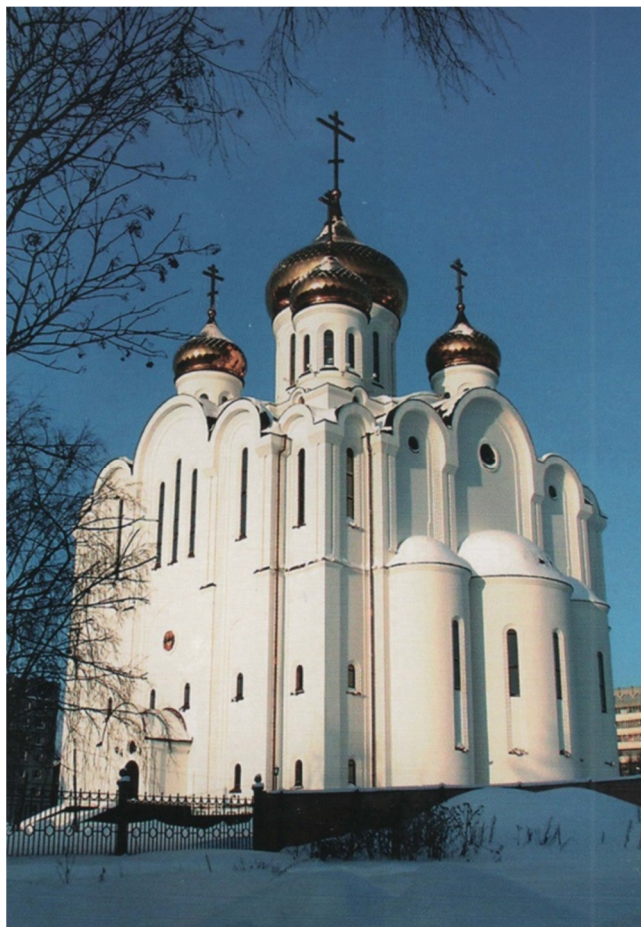
Свято-Стефановский Кафедральный собор