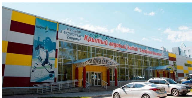
Ледовый дворец «Северная Олимпия». 2011 год

В постсоветский период в Сыктывкаре появились новые печатные издания: журналы «Регион», «Арт» («Лад»; 1997 г.), «Государственное управление в Республике Коми», «Чужан кыв» («Родное слово») и «На рубеже»; первая в республике полноцветная газета «Столица» (1997 г.; издавалась до 2014 г.), газеты «Панорама столицы» (1997 г.), «Твоя параллель» (2001