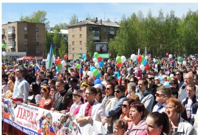
День города 12 июня 2016 года

В 2010 году было подписано Соглашение о социальном партнерстве между администрацией муниципального образования и городским представительством движения «Коми войтыр». По инициативе и при актив-