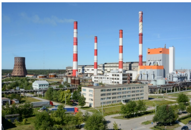
Монди Сыктывкарский ЛПК

В состав комбината сегодня входят древесно-сырьевое, сульфат-целлюлозное и картонно-бумажное производства. Предприятие располагает тремя современными бумагоделательными машинами и одной картоноделательной машиной. Сегодня АО «Монди Сыктывкарский ЛПК» является крупнейшим производителем бумаги в России, СНГ и Европе и специализируется на выпуске офисной и офсетной бумаги, а также газетной бумаги, тарного картона и товарной целлюлозы. Самая известная продукция Сыктывкарского ЛПК – офисная бумага «Снегурочка».