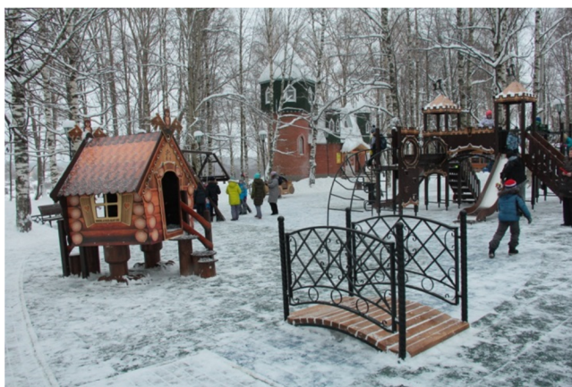
Парк им. Кирова после реконструкции. 2016 год