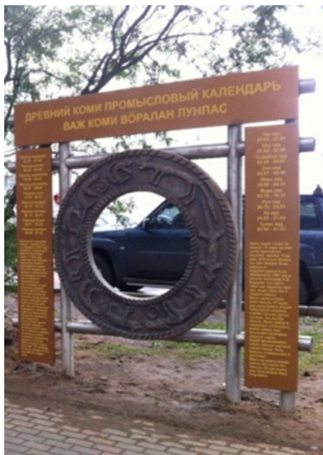
Памятный знак коми промысловому календарю. 2013 год