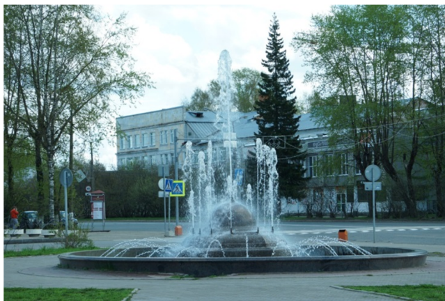
Театральная площадь после реконструкции. 2008 год

Была реконструирована главная улица города – Коммунистическая – в центральной исторической части города на участке между улицами Советская и Кирова, а также Кирова и Ленина (2019 г.). Выполнено обустройство пешеходных тротуаров в гранитном исполнении серого и светло-серого цвета, отремонтировано дорожное полотно, модернизировано освещение, капитально отремонтирован памятник павшим в боях за советскую власть в Коми крае, установлены новые малые архитектурные формы из чугуна в классическом стиле. Лестничные марши заменены новыми конструкциями, каждая лестница дублируется пандусом. Высажены высокоствольные деревья пород липа и клен.