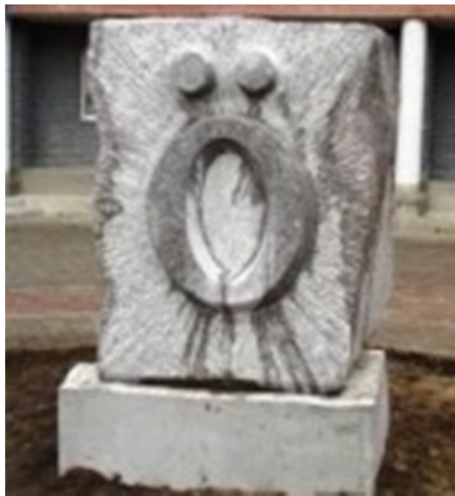
Памятный знак букве коми алфавита «Ӧ». 2011 год

На ежегодных районных конференциях коми народа организация «Эжваса комияс» поднимала актуальные социально-экономические вопросы, которые получали отражение в их тематике конференций: «Эжва: сегодня и завтра» (2010 г.), «Создание условий для реализации проектов по сохранению языковой среды и традиционной культуры коми народа в районе» (2011 г.), «Вовлечение населения района в общественную жизнь «Эжваса комияс» (2013 г.), «Укрепление связей с общественными и национальными объединениями» (2014 г.), «Развитие кадрового потенциала в районе» (2016 г.); «Развитие городской среды: навстречу 55- ле-