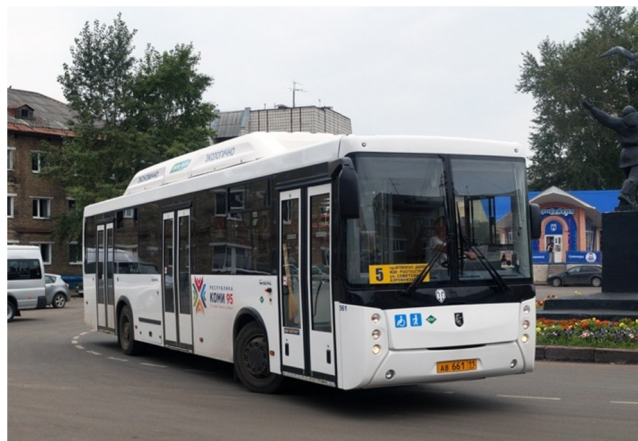
Автобус Нефаз на улицах Сыктывкара

нием собственного канала телевидения на всю республику, увеличением общедоступных телевизионных программ, распространением спутникового телевидения, позволяющего принимать программы крупнейших телекомпаний мира, созданием разветвленной сети кабельного телевидения. Сыктывкар вошел в мировую компьютерную сеть «Интернет», стали развиваться такие перспективные отрасли связи, как электронная почта, видеосвязь и др. Ведущим оператором фиксированной связи в городе является Коми филиал ОАО «Ростелеком». С 2010 года в Сыктывкаре работает оператор Wi-Max, компания «Энфорта». На территории города действуют несколько бесплатных Wi-Fi-зон доступа к Интернету. Услуги мобильной связи предоставляют четыре основных оператора МТС, Теле-2, Мегафон и БиЛайн.