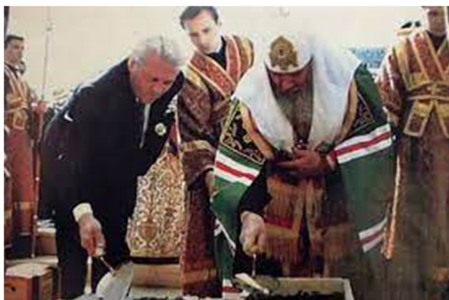
Патриарх Алексей II и Глава Республики Коми Спиридонов Ю.А. на закладке Свято-Стефановского Кафедрального собора. 9 мая 1996 года

После 1991 года в Сыктывкаре было возведено более 20 храмов и часовен. 9 мая 1996 года на улице Свободы был заложен фундамент Свято-Стефановского собора. Закладной камень фундамента освятил патриарх Алексей II. 26 августа 2001 года епископ Питирим совершил малое освящение нового собора и отслужил первую Божественную литургию. Главным храмом республики Свято-Стефановский собор стал 26 апреля 2005 года, когда патриарх Алексей II своим указом присвоил собору статус кафедрального. 6 октября 2013 года,