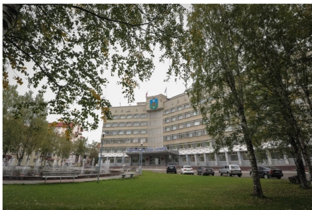
Администрация города Сыктывкара

Первые выборы в советы города Сыктывкара и Эжвинского района были проведены 8 мая 1994 года (советы городских поселков с этого времени не выбирались). Депутаты избирались на четыре года по так называемой мажоритарной системе относительного большинства (побеждал кандидат, набравший хотя бы на один голос больше, чем остальные кандидаты; не требовалось, чтобы за победителя проголосовало больше половины участвовавших в голосовании). Кандидаты выдвигались группами избирателей и общественными объединениями. Для регистрации кандидатам необходимо было собрать 5% подписей избирателей округа. Выборы признавались несостоявшимися, если в них приняли участие меньше 25% избирателей. Перед выборами численность депутатов Совета Сыктывкара была сокращена со 150 до 25, Совета Эжвинского района – с 75 до 16. В городской совет было выдвинуто 110, из них зарегистрировано 85 кандидатов, в том числе два народных депутата Верховного Совета Коми АССР XII созыва, 19 народных депутатов городского Совета предыдущего созыва, 17 женщин. Городская Ассоциация руководителей промышленных предприятий выдвинула кандидатов почти в каждом избирательном округе столицы. Были избраны все 25 депутатов Совета Сыктывкара и 15 депутатов Совета Эжвинского района (из 16).