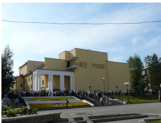
Открытие Драмтеатра после реконструкции. Август 2009 года

В 1992 году был основан Театр фольклора – единственный в республике профессиональный театр, созданный с целью сохранения самобытной коми национальной культуры и коми языка (с 2005 года – Национальный музыкально-драматический театр Республики Коми). За время существования театром поставлено более 60 спектаклей и концертов. Театр представлял культуру России и Коми и был отмечен дипломами на фестивалях в Норвегии, Финляндии, Эстонии, Болгарии и др. В 2000 – 2007-х годах театр провел I–VI Международный финно-угорский фестиваль театрального творчества для детей и юношества «Ен дзирд» («Божественная искорка»).