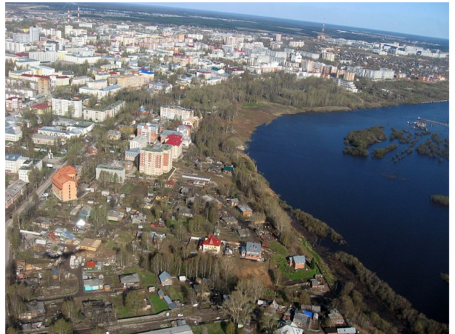
Сыктывкар. Общий вид на центр города.

счет повышения уровня благоустройства города и модернизации социальной сферы; создание элементов конкурентоспособной инновационной экономики; завершение формирования нового экономического и пространственного облика города в соответствии с его миссией и стратегической целью. Сегодня Сыктывкар уверенно смотрит в будущее.