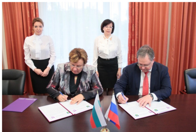
Подписание Соглашения с городом-побратимом Ловеч в администрации города Сыктывкара. 11 июня 2018 года

Договор о побратимских отношениях с городом Лос-Алтос был подписан в 1989 году во время первого визита делегации этого города в Сыктывкар. В рамках договора состоялся обмен группами студентов и учащихся школ, выступления в США сыктывкарского творческого коллектива «Балалайка», участие воспитанников городской школы искусств в международном конкурсе «Молодая Америка. Гран-при» в 2009 и 2010 годах. Делегация Сыктывкара посещала Лос-Алтос в 2008 и 2011 годах. В 2008 году во время визита сыктывкарской делегации в Лос-Алтосе была установлена стела с указателями расстояний до побратимов (до Сыктывкара – 5585 миль). В 2010 году Сыктывкар посетила делегация Лос-Алтоса во главе с мэром города.